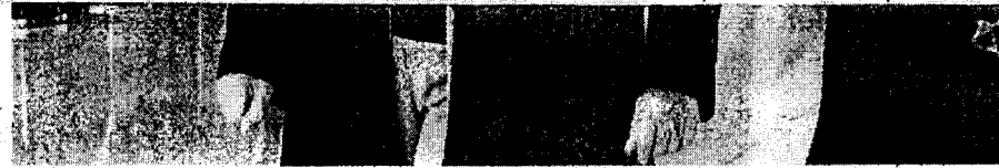
Em seu primeiro dia, Dilma Rousseff visitou a sede do banco na cidade chinesa de Xangai