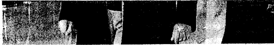
Em seu primeiro dia, Dilma Rousseff visitou a sede do banco na cidade chinesa de Xangai

O chamado "Banco dos BRICS" é responsável por financiar projetos de infraestrutura e desenvolvimento dos países que fazem parte do grupo. Em seu primeiro dia, a nova presidente também visitou a sede do banco na cidade chinesa. Fotos do momento foram divulgadas pela conta oficial da instituição no Twitter. É importante destacar que as viagens de Lula e Dilma à China são agendas distintas. O presidente do Brasil, inclusive, precisou adiar o seu embarque para o país asiático devido ao diagnós-