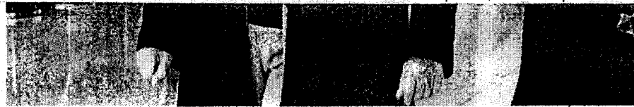
Em seu primeiro dia, Dilma Rousseff visitou a sede do banco na cidade chinesa de Xangai

de Dilma foi unanimemente aprovado por um comitê e ela substituirá o diplomata Marcos Troyjo, também brasileiro, que havia sido indicado pelo governo de Jair Bolsonaro, em 2020. Após a nomeação, Rousseff viajou à Xangai, na China, para tomar posse da presidência da instituição e realizar sua primeira reunião no cargo. O chamado "Banco dos BRICS" é responsável por financiar projetos de infraestrutura e desenvolvimento dos países que fazem parte do grupo. Em seu primeiro dia, a nova presidente também visitou a sede do banco na cidade chinesa. Fotos do momento foram divulgadas pela conta oficial da instituição no Twitter. É importante destacar que as viagens de Lula e Dilma à China são agendas distintas. O presidente do Brasil, inclusive, precisou adiar o seu embarque para o país asiático devido ao diagnóstico